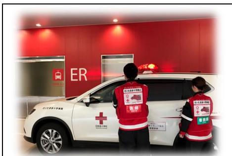
令和4年度ドクターカー実績