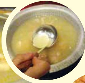
コラーゲンボール投入！

新鮮な鶏の脚ガラのみを専用釜で炊き上げた、コクがあってさらりとした口当たりのスープ。スーと体にしみこむ逸品です♪