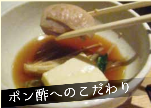
ポン酢へのこだわり

水炊きに欠かせないポン酢にもこだわりを感じました。鶏の旨味をさらに引き立ててくれます。