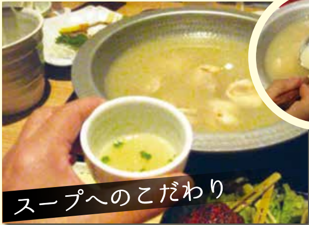
スープへのこだわり

店内は、カウンター席とテーブル席があります。お一人様から宴会まで、様々なシーンで利用させて頂けそうです。